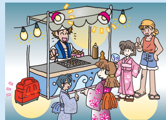
必要なところにすぐ電源