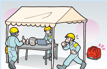
防災拠点、救援物資の配送拠点での電源として 電気ポット、ライト、炊飯器等家庭用電源として